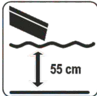
Wassertiefe 55 cm