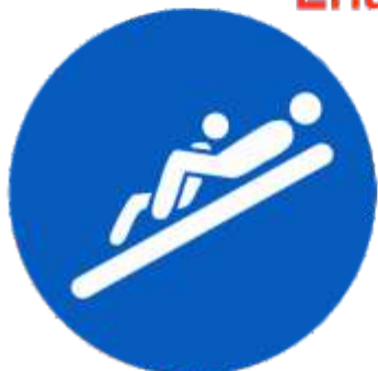
Kind vor einem Erwachsenen liegend, Füße voraus