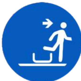
Umgehend die Auffangeinrichtung rechts verlassen