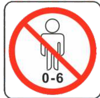
Benutzer bis 6 Jahre nicht erlaubt