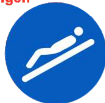
Rückenlage Füße voraus