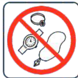
Schmuck und Schlüssel vor dem Rutschen ablegen!